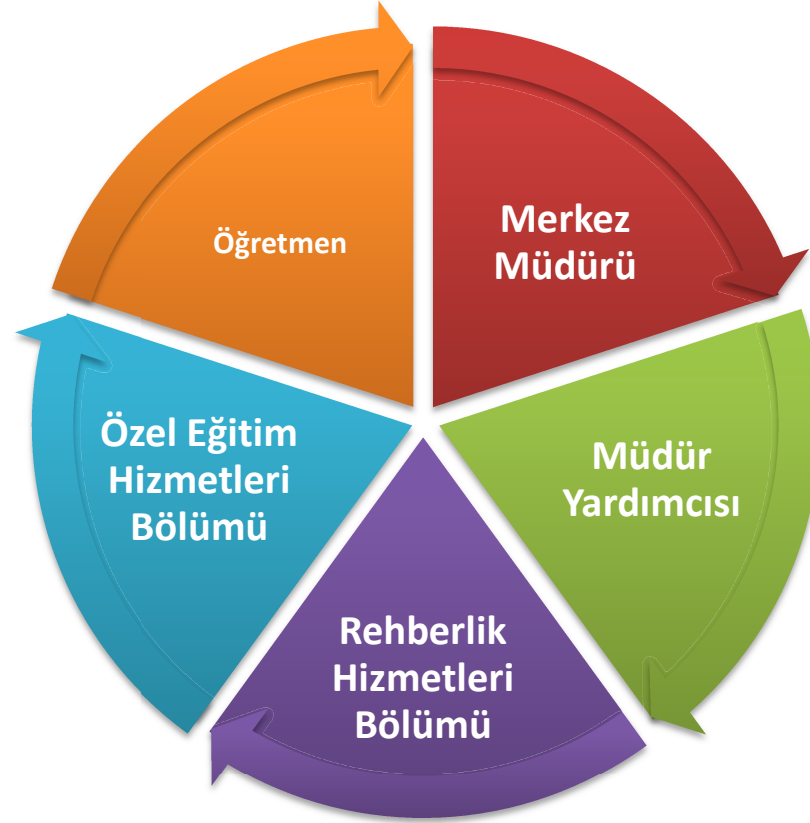
ŞEKİL:1 PAYDAŞ ANALİZİ

Paydaş anketlerine ilişkin ortaya çıkan temel sonuçlara altta yer verilmiştir: